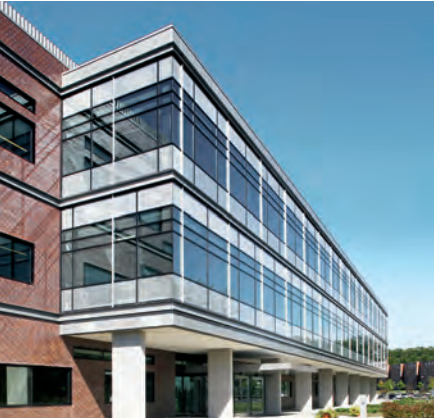
Schüco Aluminium door system ADS 65 HD Schüco Aluminium-Türsystem ADS 65 HD

Aluminium Door System Aluminium-Türsystem